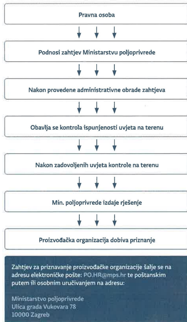
Graf 2. Koraci u priznavanju proizvođačke organizacije