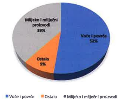
Graf 4. Zastupljenost proizvođačkih organizacija prema sektoru poljoprivredne proizvodnje u Europskoj uniji u 2019. godini